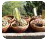
» Orto Botanico "Lorenzo Rota"