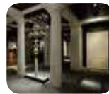
» Museo e Tesoro della Cattedrale