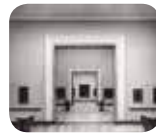
» Pinacoteca dell'Accademia Carrara