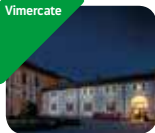
» MUST Museo del territorio vimercaese