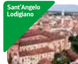
» Musei del Castello Bolognini