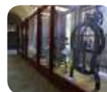
» Musei Civici "L. Barni" - Museo dell'imprenditoria Vigevese