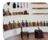
» Museo Bergomi