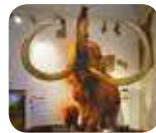
» Museo Civico di Scienze Naturali "E. Caffi"