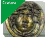
» Museo Archeologico dell'Alto Mantovano