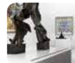
» Museo del Novecento