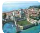
» Castello Scaligero