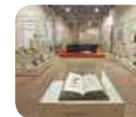
» Musei Civici "L. Barni" - Museo della Calzatura "Pietro Bertolini"