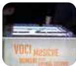
» Museo Interattivo del Cinema