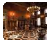
» Museo Bagatti Valsecchi