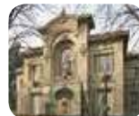
» Acquario Civico

Informazioni e orari di apertura: www.abbonamentomusei.it 800 329 329