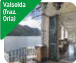
» Villa Fogazzaro Roi