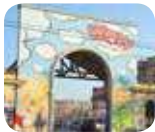
» WOW Spazio Fumetto