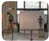
» Studio Museo Francesco Messina