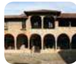
» Convento di San Francesco/ Museo Storico/ Museo della fotografia Sestini