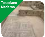
» Villa Romana di Toscolano Maderno