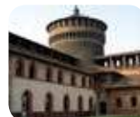
» Musei del Castello Sforzesco