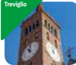
» Museo Storico Verticale