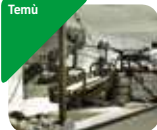
» Museo della Guerra Bianca in Adamello