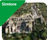
» Area Archeologica delle Grotte di Catullo e Museo Archeologico di Sirmione