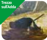
» Quadreria Crivelli