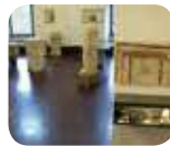
» Museo Civico Archeologico