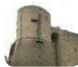
» Rocca - Museo Storico Sezione '800