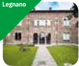
» Palazzo Leone da Perego