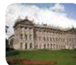
» Galleria d'Arte Moderna