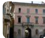
» Museo Storico "Giuseppe Garibaldi"