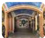
» Cappella Espiatoria