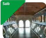
» MuSa - Museo di Salò