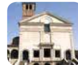
» Tempio di San Sebastiano