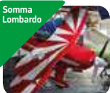
» Volandia Parco e Museo del Volo