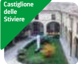
» Museo Internazionale della Croce Rossa