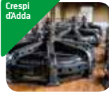
» Centrale idroelettrica di Crespi d'Adda