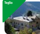
» Palazzo Besta e Museo Archeologico