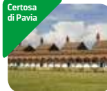
» Museo della Certosa di Pavia