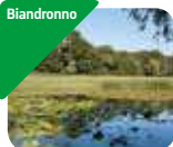
» Museo Civico Preistorico dell'Isolino Virginia