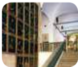
» Museo Diocesano Carlo Maria Martini