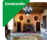
» Castello di Zavattarello e Museo d'Arte Contemporanea