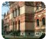
» Museo di Storia Naturale