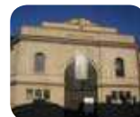
» Museo Archeologico Nazionale di Mantova