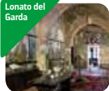
» Museo Casa del Podestà