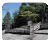
» Parco Nazionale delle Incisioni Rupestri