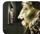
» Grande Museo del Duomo