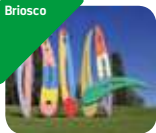
» Rossini Art Site