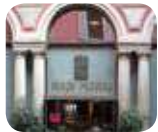
» Museo Poldi Pezzoli