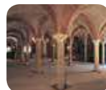
» Cripta di San Giovanni in Conca