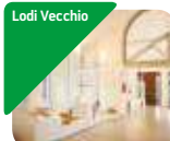
» Museo "Laus Pompeia"