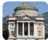
» Tempio Voltiano