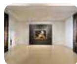
» Museo Lechi