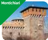
» Castello Bonorisi