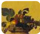
» Pinacoteca Ambrosiana