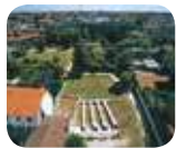
» Parco dell'Anfiteatro Romano e Antiquarium "Alda Levi"