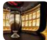
» Casa Milan - Museo Mondo Milan