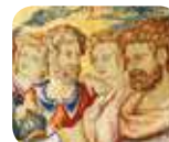
» Museo d'Arte e Scienza