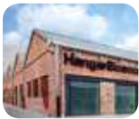
» Pirelli HangarBicocca