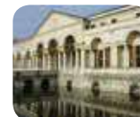
» Museo Civico di Palazzo Te