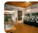
» Museo Valtellinese di Storia e Arte