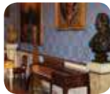
» Museo Teatrale alla Scala