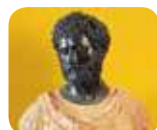
» Museo Diocesano Francesco Gonzaga