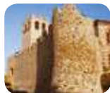
» Castello - ricetta di Desenzano del Garda