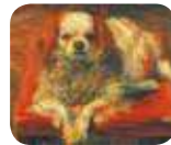
» Galleria d'Arte Moderna e Contemporanea - GAMeC