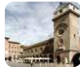
» Palazzo della Ragione e Torre dell'Orologio