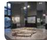
» Civico Museo Archeologico