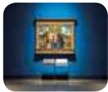
» Pinacoteca di Brera