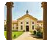
» MUBA - Museo dei Bambini Milano