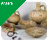
» Civico Museo Archeologico