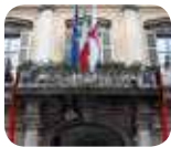
» Palazzo Moriggia - Museo del Risorgimento