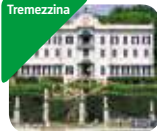
» Villa Carlotta - Museo e Giardino Botanico