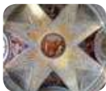
» Villa Reale di Monza