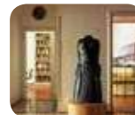
» Casa Museo Boschi Di Stefano