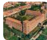
» Musei Civici del Castello Visconteo