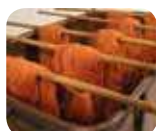
» Museo Didattico della Seta