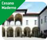
» Palazzo Arese Borromeo