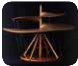
» Museo Nazionale della Scienza e della Tecnologia Leonardo da Vinci