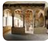
» Palazzo del Podestà/ Museo Storico/ Età Veneta/ Il '500 Interattivo