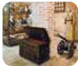
» Museo Mangini Bonomi