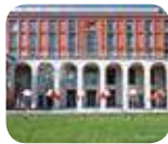
» Triennale di Milano