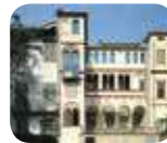
» Museo Adriano Bernareggi