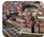
» Palazzo Ducale