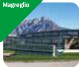
» Museo del Ciclismo Madonna del Ghisallo