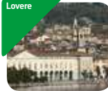
» Galleria dell'Accademia Tadini