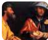
» Pinacoteca Tosio Martinengo