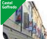
» MAST Castel Goffredo - Museo della città