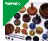
» Museo Archeologico Nazionale di Vigevano