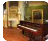
» Museo Donizettiano