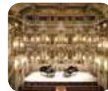
» Teatro Scientifico Bibiana