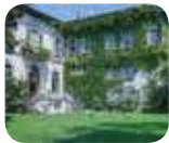
» Vigna di Leonardo