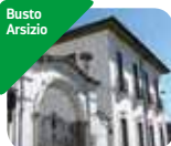
» Civiche Raccolte d'Arte di Palazzo Marliani Cicogna