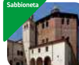
» Chiesa della Beata Vergine Incoronata