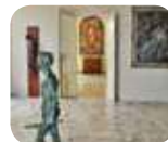
» GASC Galleria d'Arte Sacra dei Contemporanei