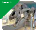
» Museo Archeologico della Valle Sabbia