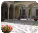
» Palazzo Morando - Costume Moda e Immagine